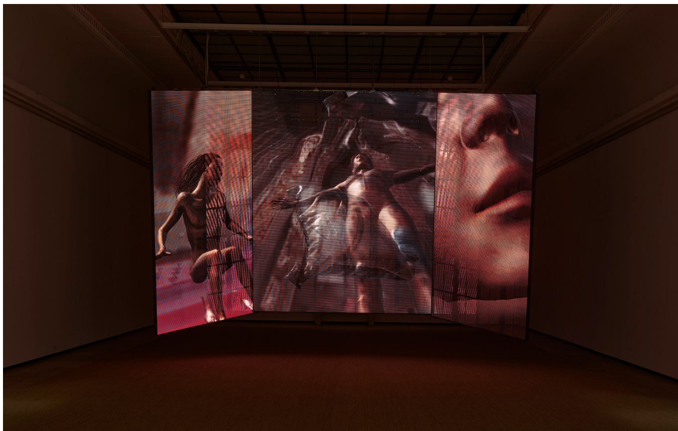
Wang Shui, Certainty of the Flesh , 2023. Multichannel live simulation, LED panels, computer. Co-commissioned and produced by Haus der Kunst München. Courtesy the Artist; kurimanzutto, Mexico City/New York. Photo: Milena Wojhan