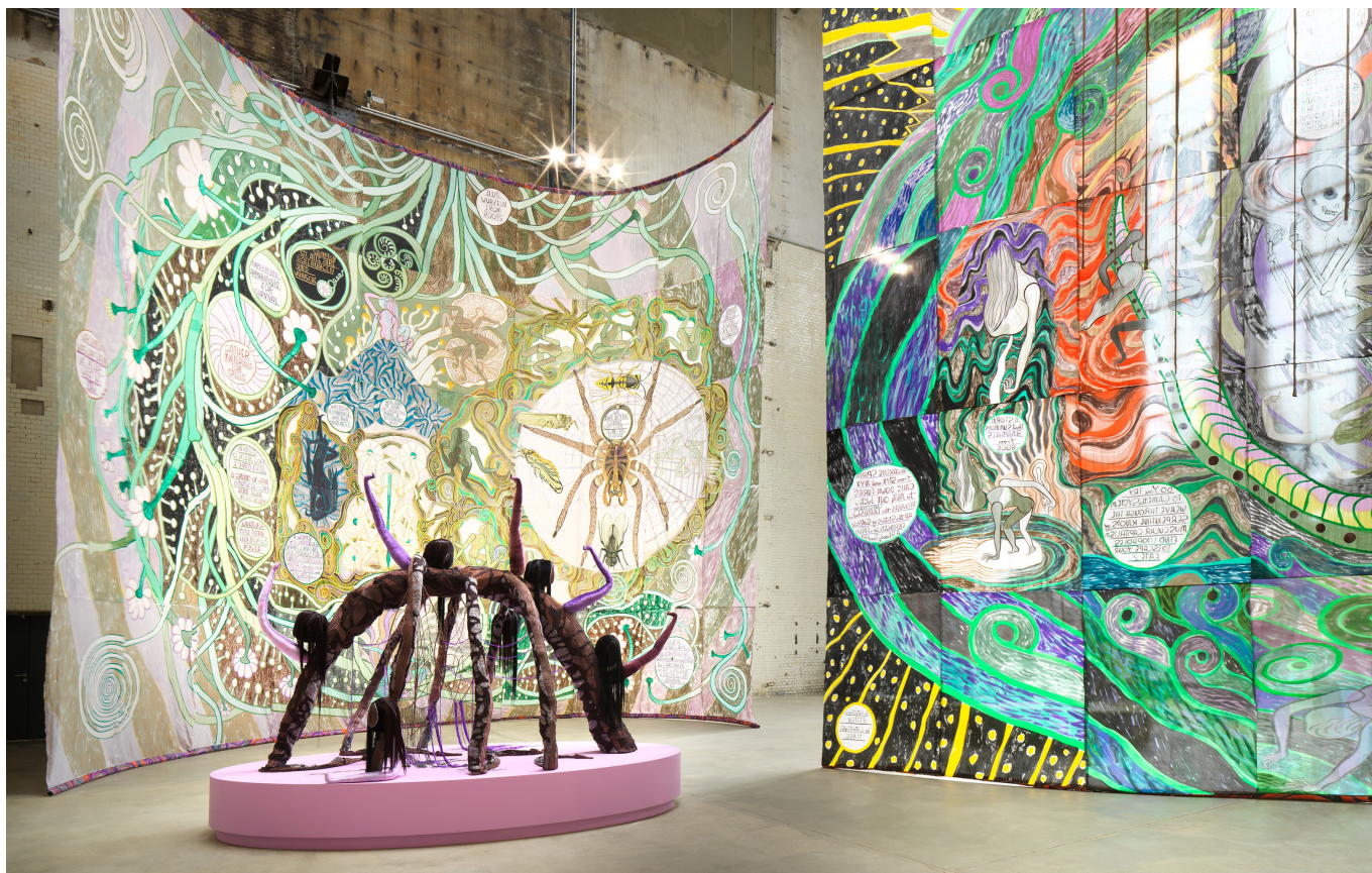
Emma Talbot, In the End, the Beginning , 2023, Installation view, Kesselhaus, KINDL, © Emma Talbot.