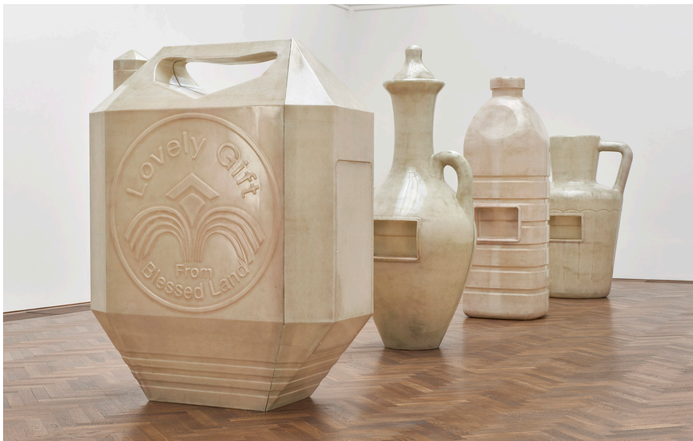
Alia Farid, In Lieu of What Is , 2022 Installation view Kunsthalle Basel.