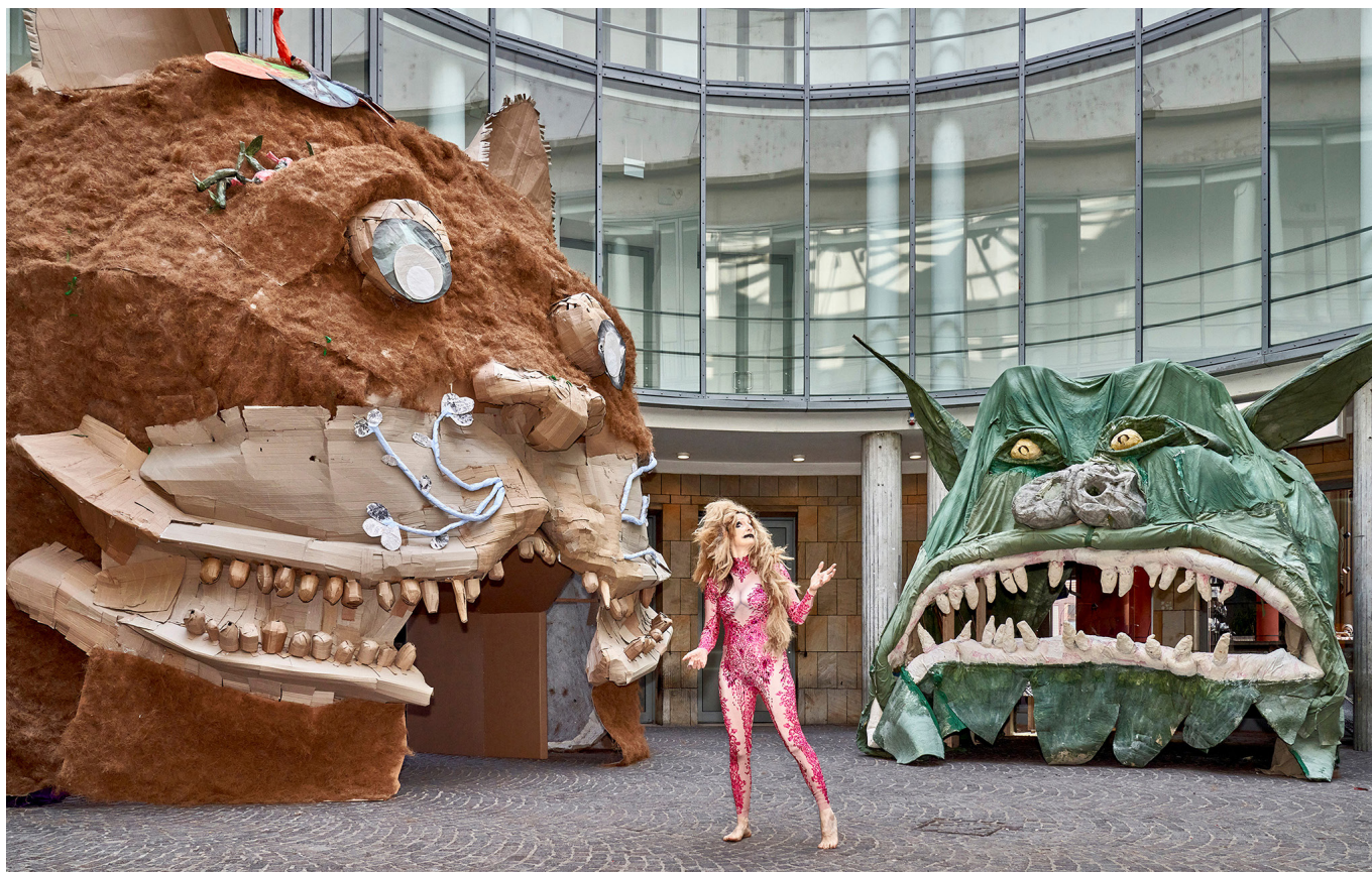
Installation view, Monster Chetwynd, A CAT IS NOT A DOG , Schirn Kunsthalle, Frankfurt, 2023 © Monster Chetwynd. Courtesy the Artist and Sadie Coles HQ, London. Photo: Norbert Miguletz / Schirn Kunsthalle, Frankfurt