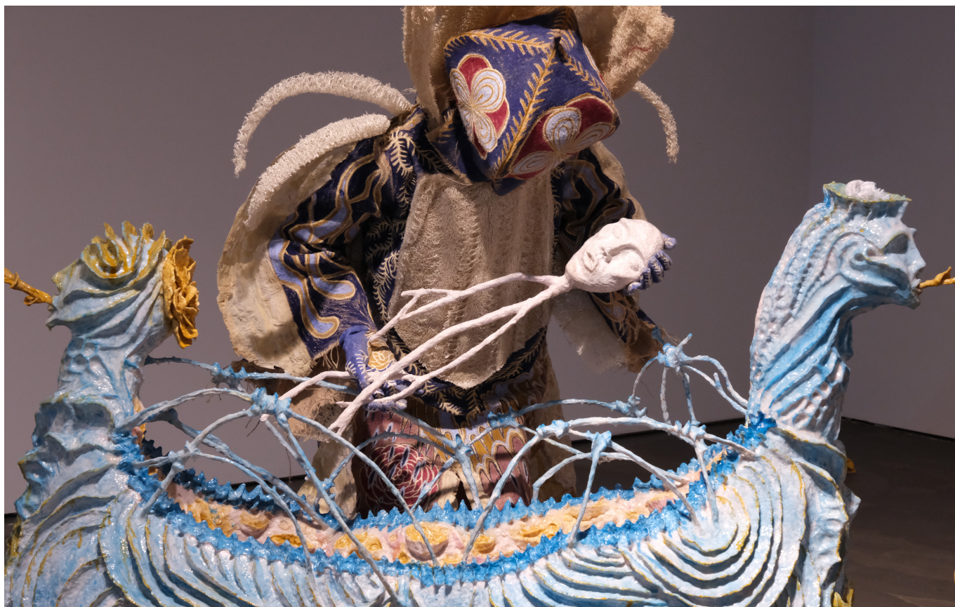
Cecilia Fiona, Infinite Pollination , 2024. Courtesy of Andersen's Contemporary and the artist Cecilia Fiona. Photo: Malle Madsen