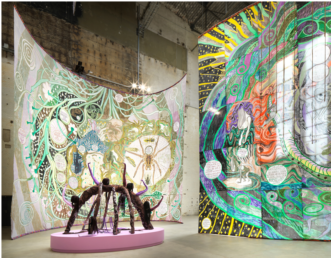
Emma Talbot, In the End, the Beginning , 2023, Installation view, Kesselhaus, KINDL, © Emma Talbot.